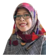
Ketua Jurusan Kajur T. Elektro