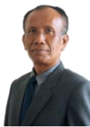
Ketua Jurusan Teknik Sipil