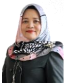
Wakil Direktur Bidang Akademik