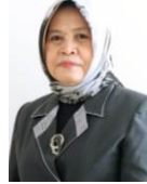
Wakil Direktur Bidang Kemahasiswaan