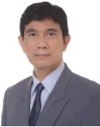
Ketua Jurusan Teknik Mesin