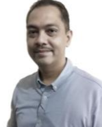
Ketua Jurusan Administrasi Niaga