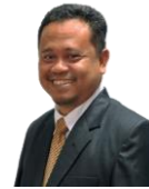
Wakil Direktur Bidang Kerjasama